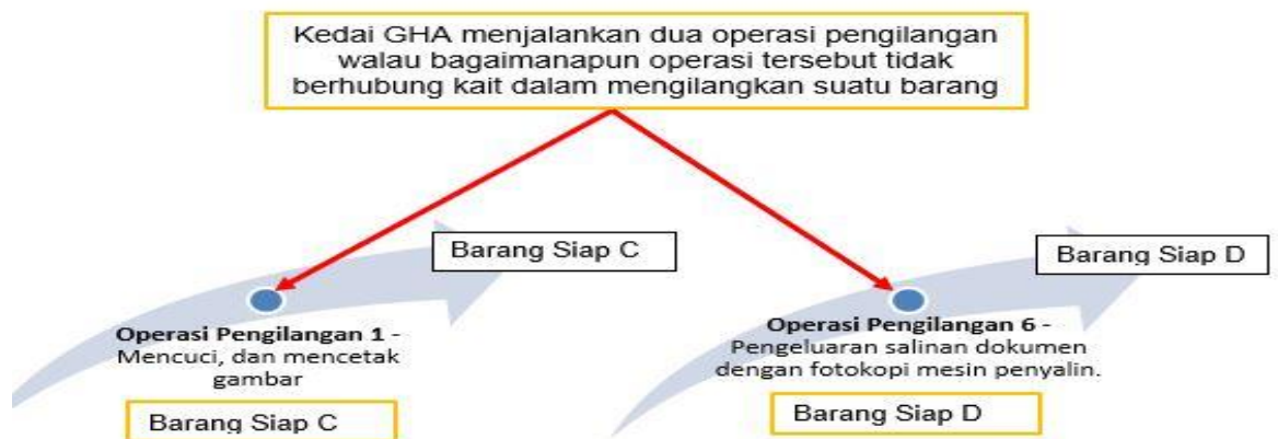
Rajah 3: Kilang GHA layak dikecualikan daripada pendaftaran kerana pengilangan barangsiap tersebut melibatkan dua operasi yang tidak berhubung kait.