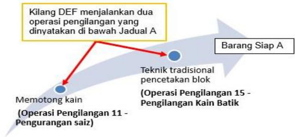
Rajah 2: Kilang DEF tidak layak diberi pengecualian daripada pendaftaran kerana menjalankan lebih daripada satu operasi pengilangan dalam menyiapkan barang siap A.