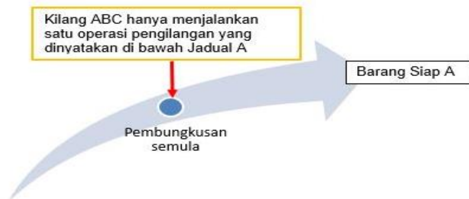
Rajah 1: Kilang ABC layak dikecualikan daripada pendaftaran kerana hanya menjalankan satu operasi sahaja dalam menyiapkan barang siap A.